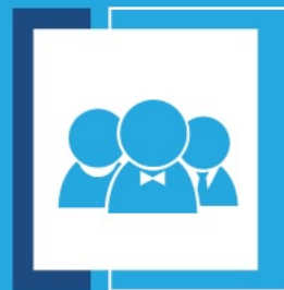
ĐỘI NGŨ CTV PARTIME